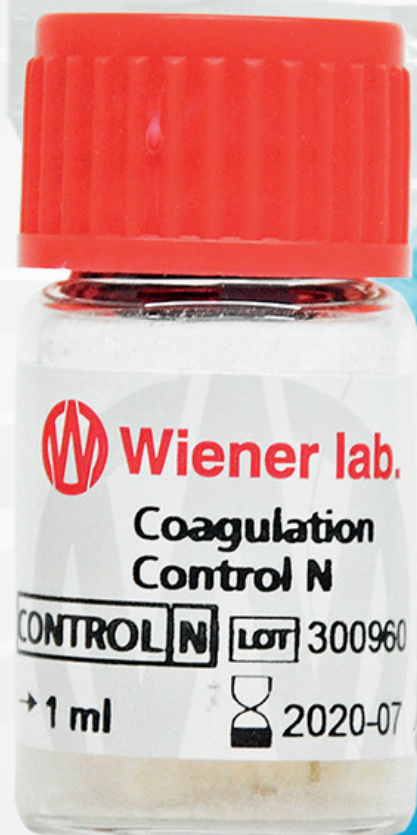
COAG.CONTROL N WIENER Stock:1 / Vto:07-20