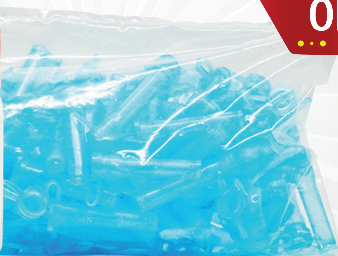
MICROTUBO Citrato DVS Stock:1 / Vto 07-20